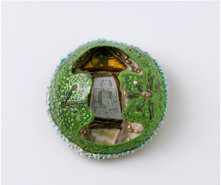
broche emaille op koper, parels, gevonden voorwerpen, tekening achter glas; 8cm